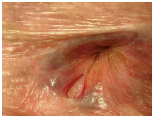
Anale fissuur of aarskloof met huidflapje en papil in de aars